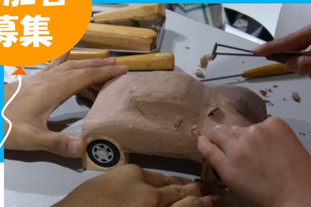
子どもカーモデラー教室の製作風景